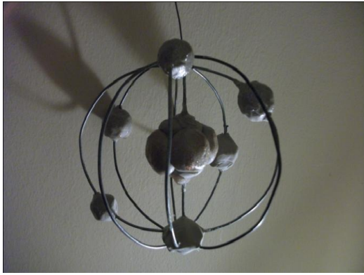
Donka Máté atommodellje