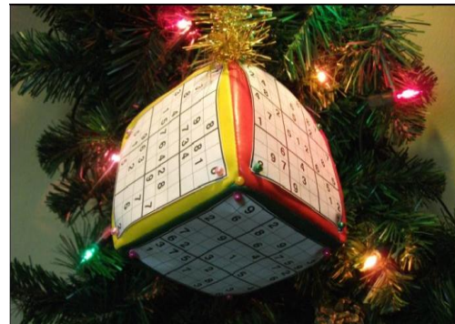
Donka Dorottya Sodukockája